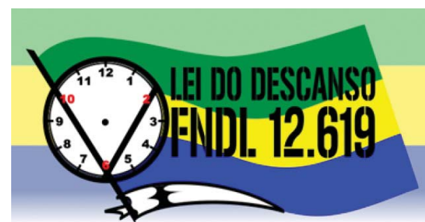
Rodoviários do Nordeste distribuem manifesto em Brasília

Grande variedade de produtos para o seu caminhão.